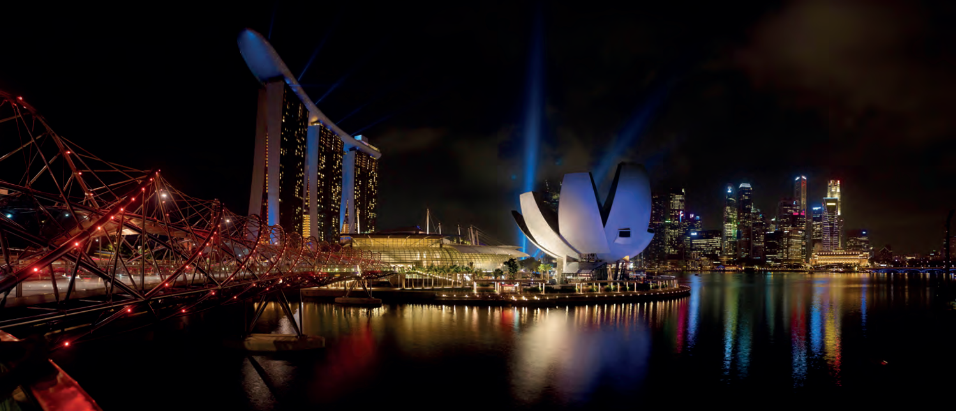
展场：新加坡滨海湾金沙艺术科技博物馆璀璨夜景。